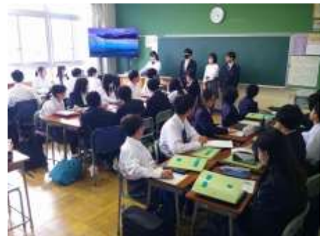
専門委員会の様子

そして、各学年では校外行事に向けて動いています。3年生は5月9日（金）～11日（日）の修学旅行の準備があと少しです。2年生は6月5日（木）の神奈川探検、1年生は6月24日（火）の相模原探検の準備を始めています。当日までの期間が限られていてたいへんだと思いますが、何事にも真剣に取り組む谷口中の生徒たちです。新しい環境で一人一人の力を結集し、絆を深めて、お互いの良さや頑張りをたたえ合える、学びの多い行事を作りあげていけるでしょう。協力は「強力」です！