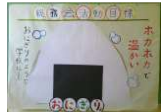
校長室横に掲示されている総務会活動目標。 いつも見えています！生徒総会お疲れさまでした。

皆さんの挨拶や言葉がけには、相手が安心して温かい気持ちになる力があるのです。私も毎日皆さんから声をかけてもらい、そこから元気をたくさんもらって、その元気で頑張っています。昨年の12月号にも書きましたが、その心を、これからも学校で一緒に過ごす仲間同士に向けて、自分のことも、仲間や周りの人のことも大切にする皆さんであってほしいと願っています。