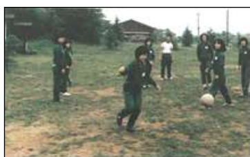
運動する谷口中生

広場を提供してくださることになり、みんなで草刈り、整地して立派な広場を作ることができました。こんなに広い遊び場ができたので第1回町内総ぐるみの楽しい運動会が華々しく開催されたのです。それから毎年春に運動会、町内対抗ドッジボール大会、少年野球大会が開かれ、歓声が響き渡りました。