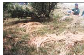
かつては原っぱだった校庭

人一倍お話好きだったおじいさんが、麦畑とその境に植えてある桑の木の間でクワを頬杖にして、長い話に花を咲かせていました。このおじいさんがこの畑の持ち主でした。その息子さんのご厚意で